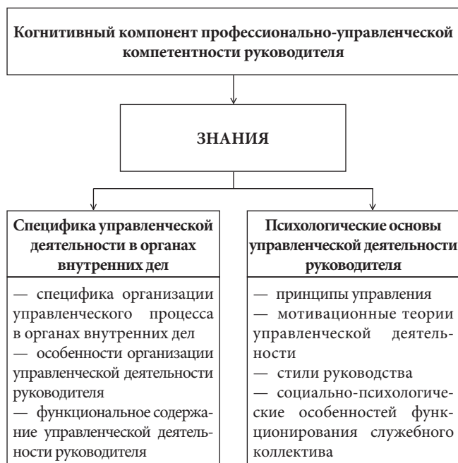
Рис. 4. Структура когнитивного компонента профессионально-управленческой компетентности руководителя

Исходя из традиционно используемой в теории менеджмента классификации управленческих функций,