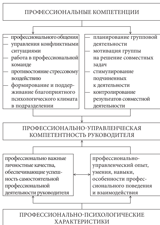
Рис. 2. Обобщенная структурная модель профессиональной компетентности руководителя

На наш взгляд, в модели профессиональной компетентности любого специалиста целесообразно рассматривать как основные компетенции, так и профессионально-психологические характеристики (профессионально важные каче-