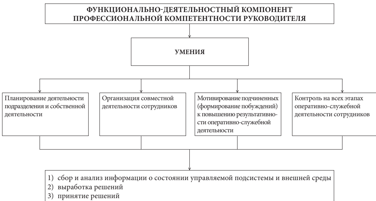
Рис. 5. Структура когнитивного компонента профессиональной компетентности руководителя